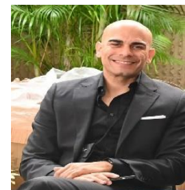
Steven Candelaria Presidente actual 2024